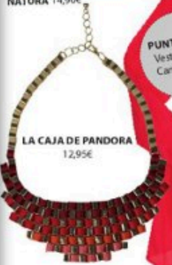
LA CAJA DE PANDORA 12,95€