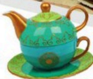
SALZILLO TEA & COFFEE Conjunto de té 27,58€