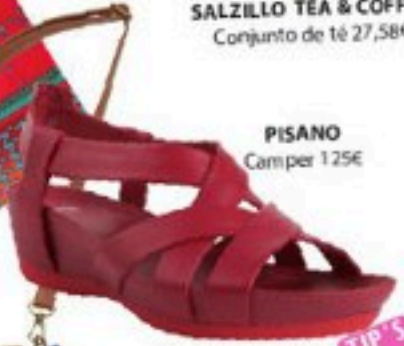
PISANO Camper 125€