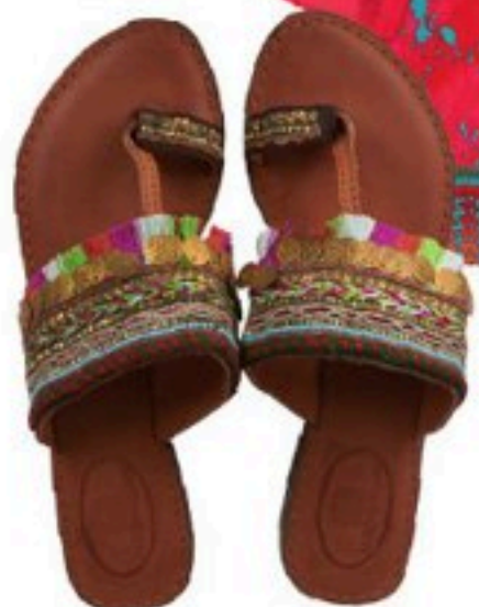
LA CAJA DE PANDORA 29,95€